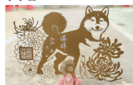
切り絵御朱印「柴犬」